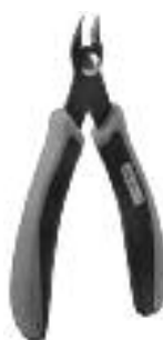
Art. Nr. 170688 SPEZIAL-SEITENSCHNEIDER

Vloeibare lijm in plastic-flacon met doseerbuisje om nauwkeurig te lijmen.